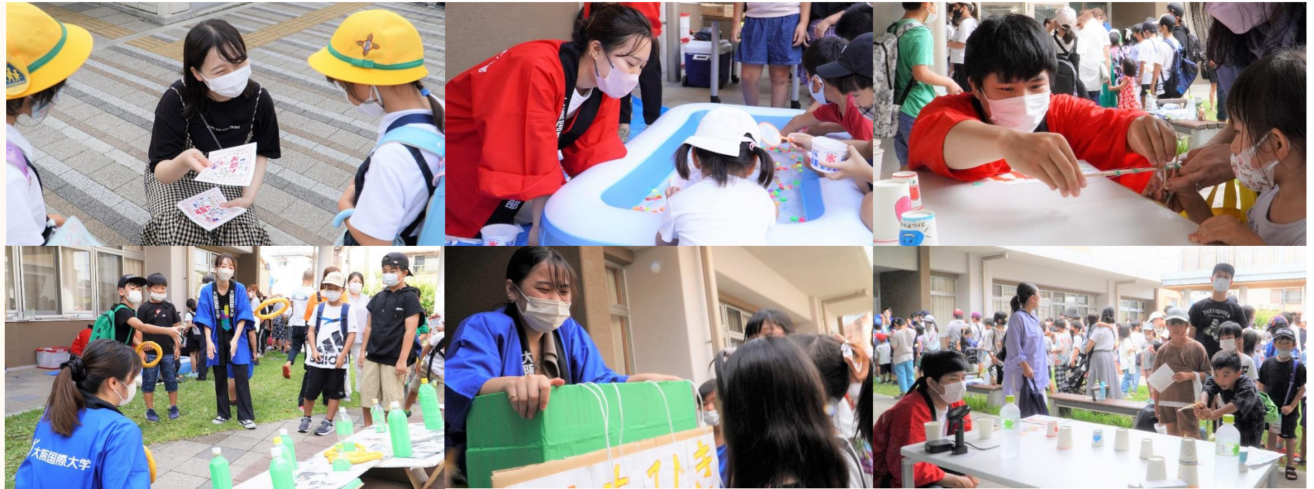
チラシのデザインと作成: 皆木秋桜乃さん