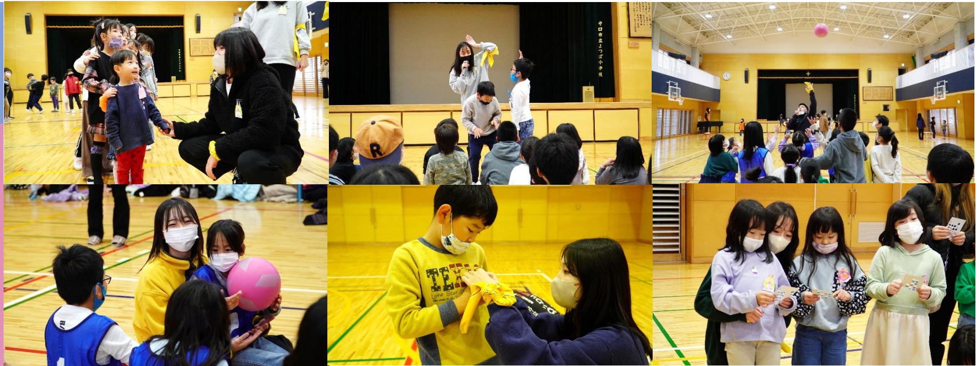
チラシのデザインと作成: 皆木秋桜乃さん