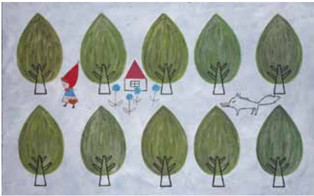
赤ずきん 森の中 (油彩・2011年)