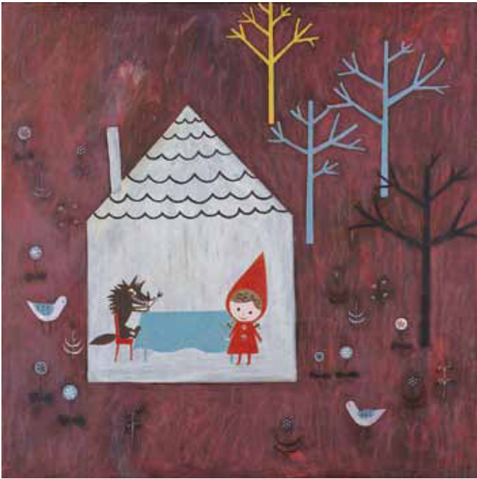
赤ずきん ますお茶から (油彩・2011年)