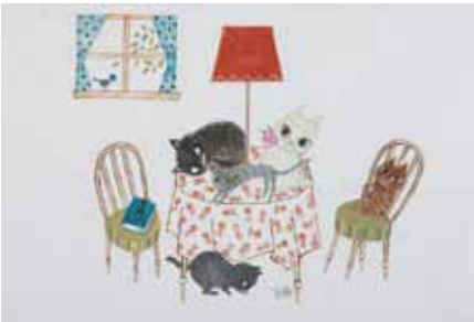
「CAT CAT CAT」のデザインラフ