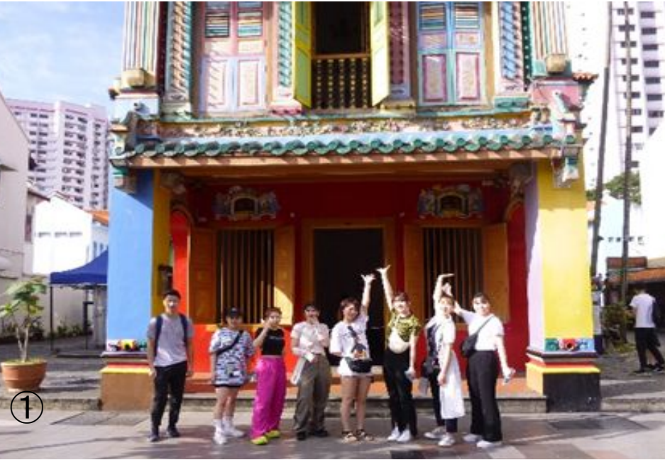
①リトル インディア (Little India)