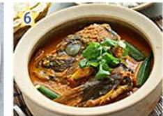
6 フィッシュヘッドカレー