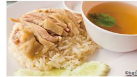
1 チキンライス(海南鶏飯)