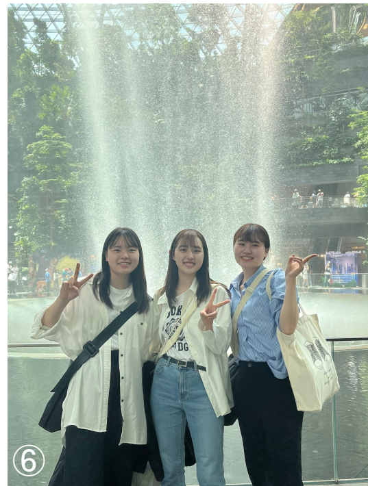
⑥ジュエル(Jewel) ※ @チャンギ空港 ※空 港内観光