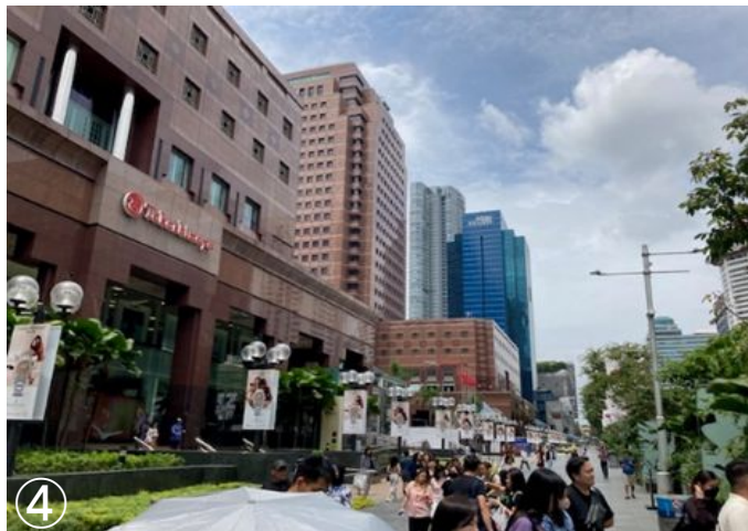
④オーチャード(Orchard) ※ シンガポールの御堂筋・心齋橋筋 ※ブラ ンド品の買い物