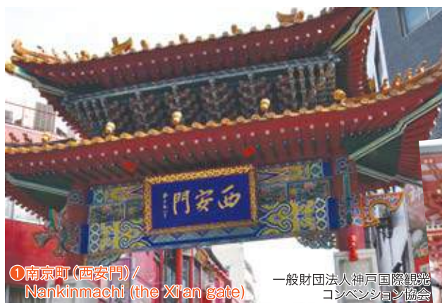
①南京町(西安門) / Nankinmachi (the Xi'an gate)