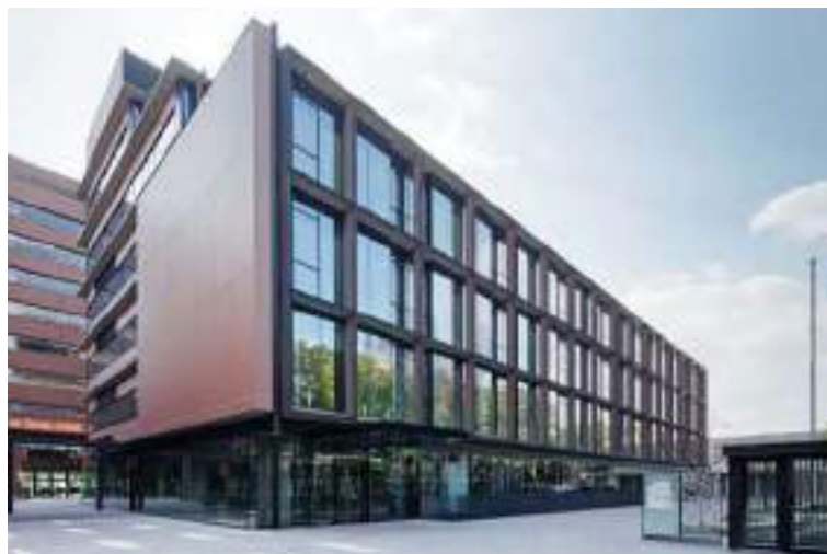
新1号館 / New Building Moriguchi Campus No. 1

Osaka International Takii High School Osaka International Owada High School Osaka International Owada Junior High School Osaka International Owada Kindergarten