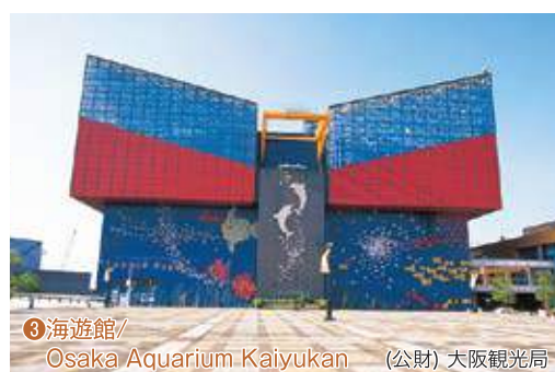
③海遊館/ Osaka Aquarium Kaiyukan (公財) 大阪観光局