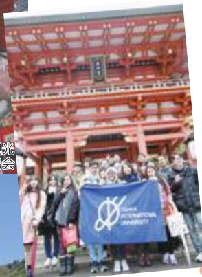
②神戸生田神社にて/ At Kobe Ikuta-jinja Shrine