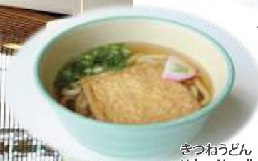
ぎつねうどん Udon Noodle Soup with Aburaage ¥250

カフェ感覚でゆっくり過ごせる スタイリッシュなキャンパス食堂 A stylish campus dining room that's like a cafe