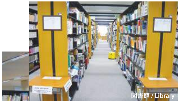
図書館 / Library