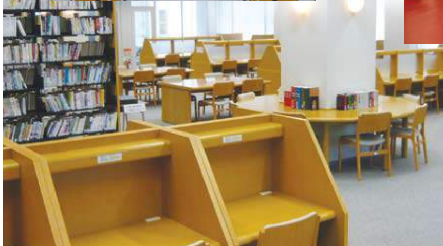
図書館 自習スペース / Study area in library