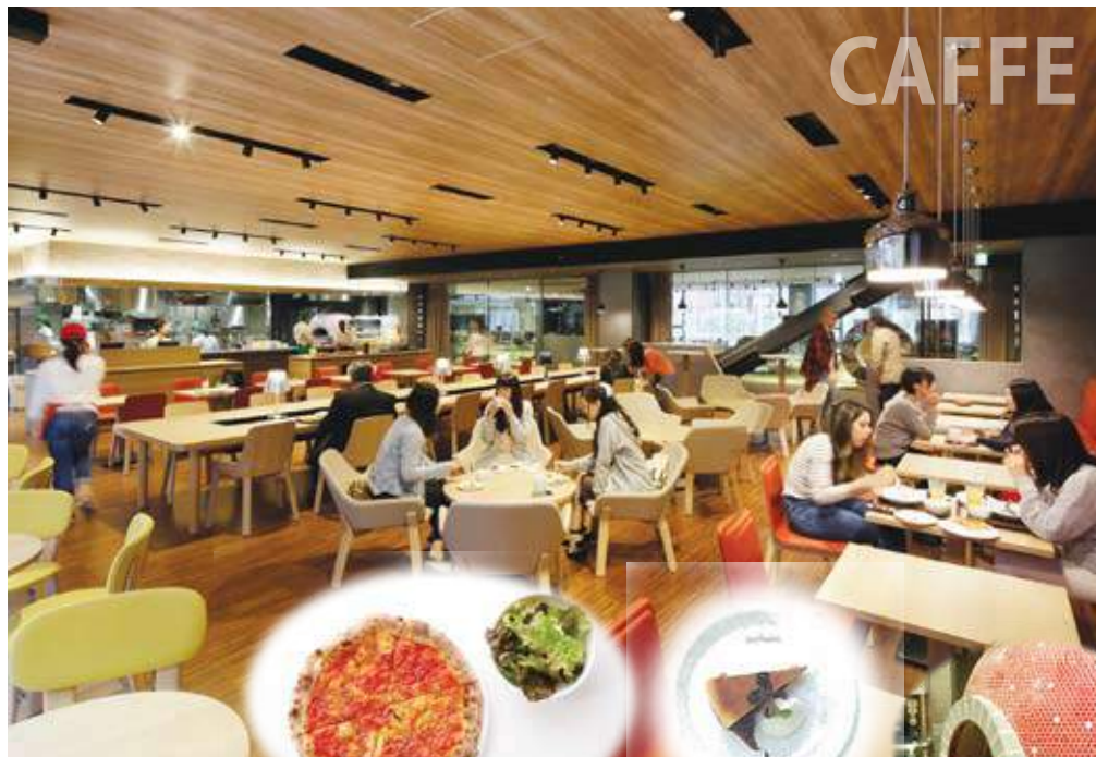
石窯オーブンで焼いた本格ピッツァ Freshly baked pizza made in a stone oven.