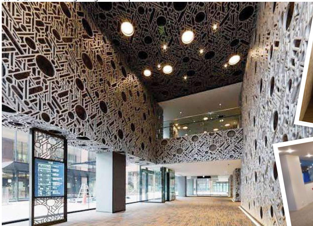
新1号館 / New Building Moriguchi Campus No.1