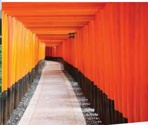
②伏見稲荷大社 千本鳥居 /Senbon Torii at Fushimi Inari Taisha