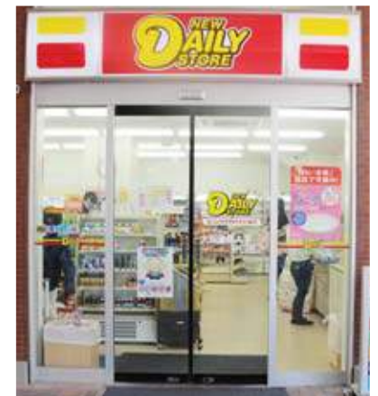
コンビニエンスストア / Convenience store