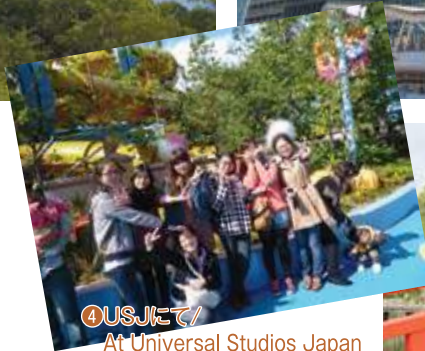
④USJにて/ At Universal Studios Japan

◀世界最大級の水族館 One of the largest aquariums in the world.