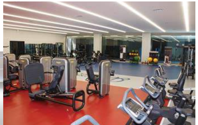
地下トレーニングジム / B1 Training gym