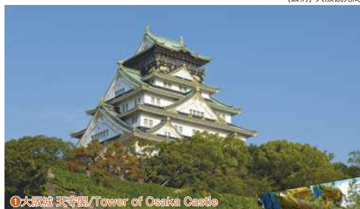
①大阪城 天守閣/Tower of Osaka Castle