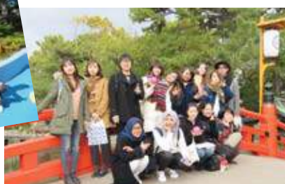
⑤住吉大社の反橋(通称:住吉大社太鼓橋)にて/ At Sumiyoshi Taisha Aka : Sumiyoshi Taisha arched bridge

◀世界最大級の水族館 One of the largest aquariums in the world.