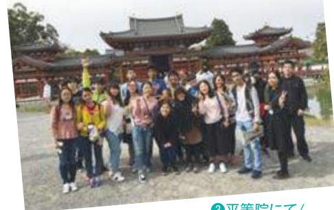
③平等院にて/ At Byodo-in