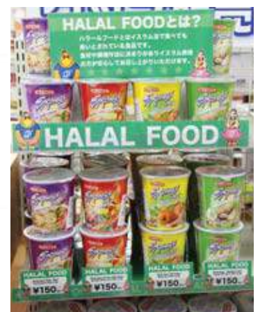
ハラール食品 / Halal food