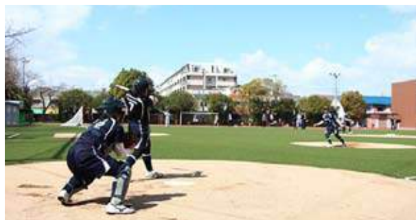
グラウンド / Athletic field in Moriguchi campus