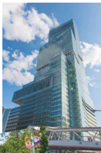
②あべのハルカス/Abeno Harukas 地上300m 高さ日本一の超高層ビル Skyscraper building 300 meters high above ground in Japan