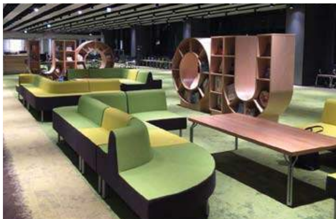
新1号館 ラーニングcommons / The New Building No.1 Learning Commons