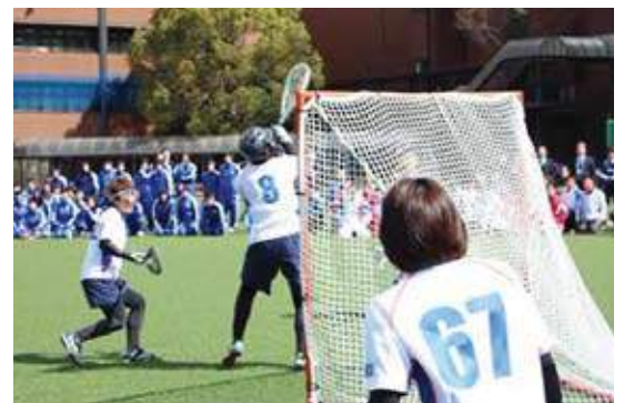
グラウンド / Athletic field