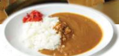
カレーライス Curry rice ¥310

カフェ感覚でゆっくり過ごせる スタイリッシュなキャンパス食堂 A stylish campus dining room that's like a cafe