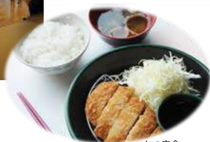
かつ定食 Cutlet set menu ¥440

どんぶり / Rice bowl ¥260~ うどん / Udon noodle ¥200~ 定食(各種) / Set menu ¥380~