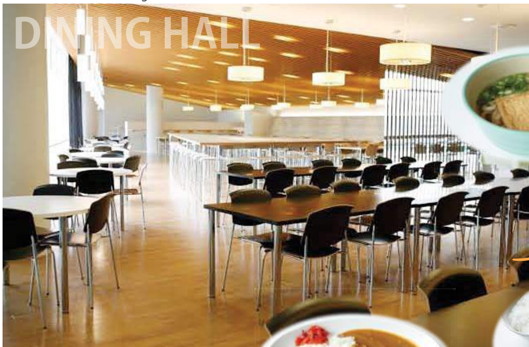
学生食堂 / Student dining hall

駅から徒歩8分の場所に位置するキャンパス Campus is located an 8-minute walk from the station.