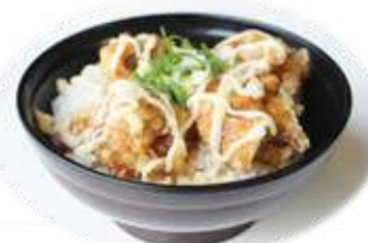
唐揚げ丼 Fried chicken rice bowl ¥400