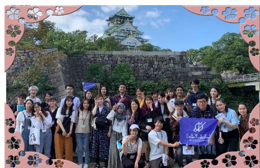
☆☆大阪の観光名所を満喫☆☆