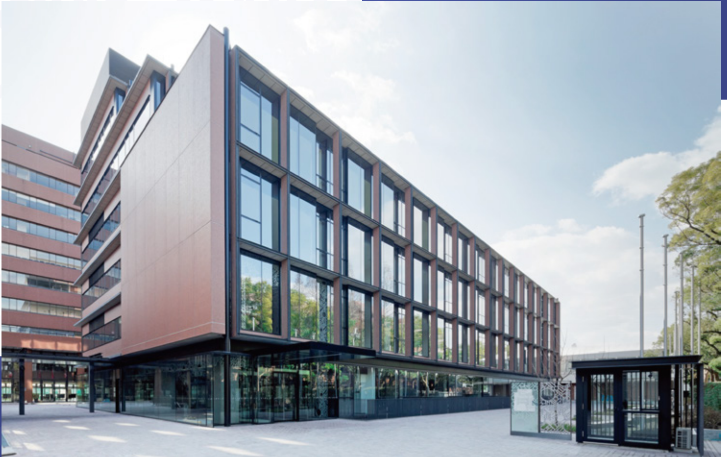
新1号館(2015年4月完成) The New Building NO.1(Completed in April, 2015)